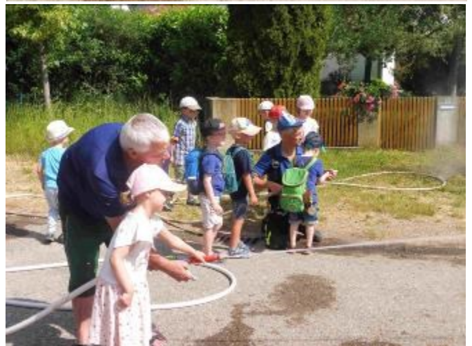
Der dringend benötigte Nachwuchs für unsere Freiwilligen Feuerwehren wird hier schon ausgebildet!