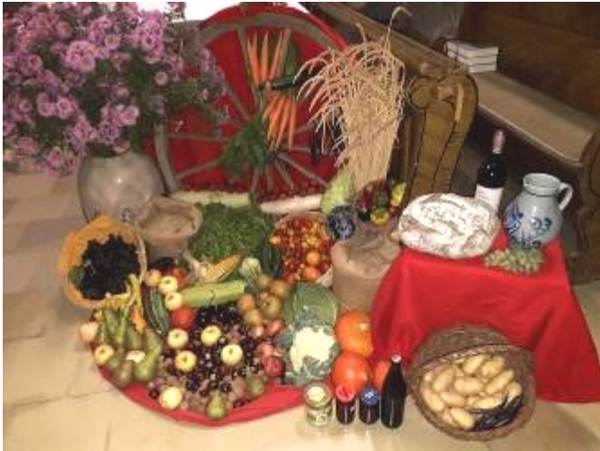
Erntedank und Segnung der Schmalzbrote in der Pfarrei Osterbuch (siehe Foto Seite 4 unten).