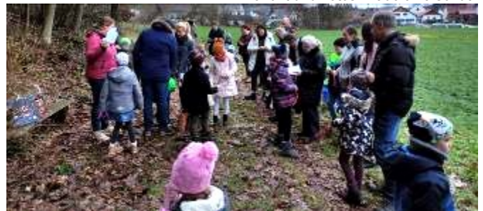
Bericht und Fotos: Madeleine Schütz