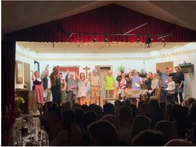
Bericht und Foto: Hermann Rager-Kempter