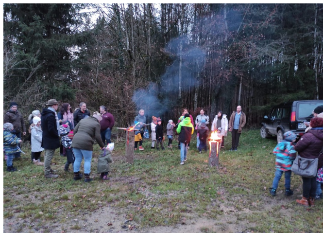
Bild Nr. 2 zum Bericht „Weihnachtswanderung als Einstimmung auf das Christkind“ der Kinderkirche Osterbuch auf Seite 11.