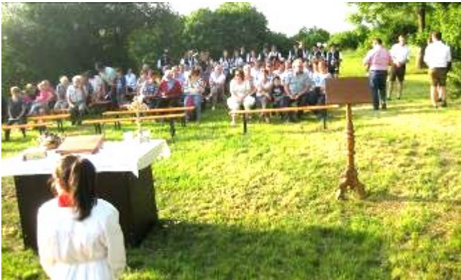
Bericht und Fotos: Marlies Abt

Bei herrlichem Wetter durften die Laugnaer am Pfingstsonntag ihren Flurumgang mit anschließender Bergmesse auf dem Geistberg begehen. Los ging's am Lagerhaus. An vier Stationen wurden Lieder, Fürbitten und ein Segensgebet für unsere Fluren vorgetragen. Zahlreiche Gläubige, die Fahnenabordnungen, die Ministranten sowie Pater Tomasz und Diakon Jürgen Brummer zogen den Berg hinauf. Oben angekommen wartete schon die Musikkapelle Laugna. Nicht nur die Gottesdienstbesucher lauschten dem Evangelium.