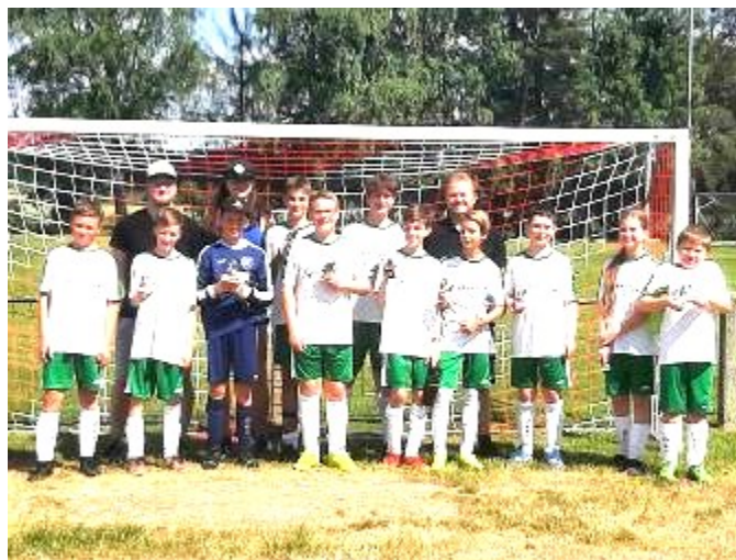
Das Bild zeigt die stolzen Dritten