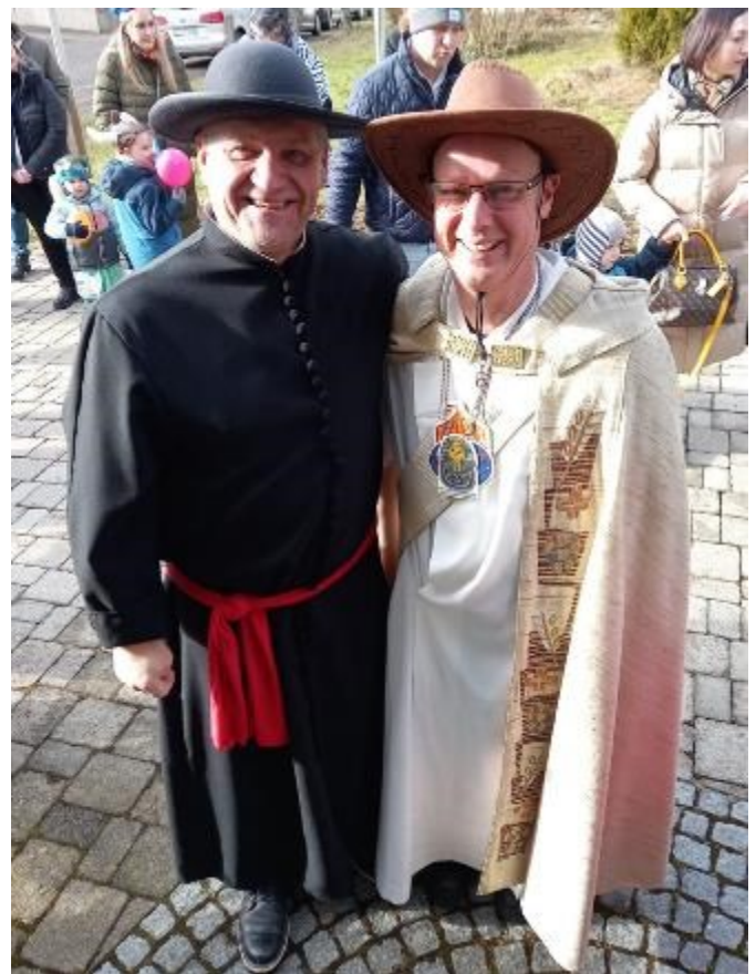
„Don Camillo und Peppone“