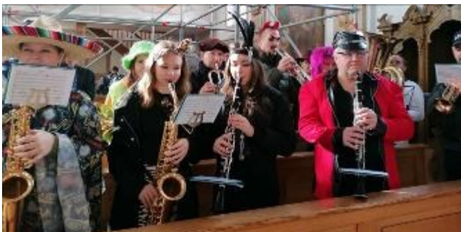
Der Osterbucher Musikverein umrahmte die schöne Andacht musikalisch.