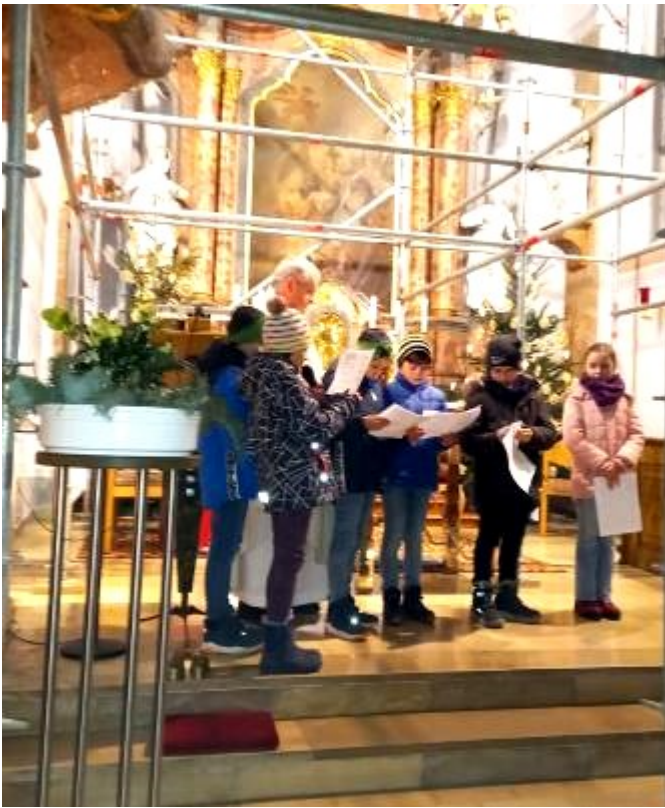
Die Kommunionkinder der Pfarren Laugna, Modelshausen und Osterbuch (von links):