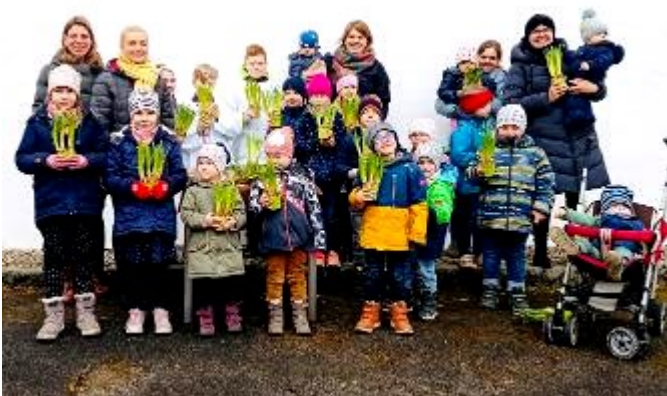
Bild oben: Begeistert waren die Kinder beim Kreuzweg aktiv dabei.