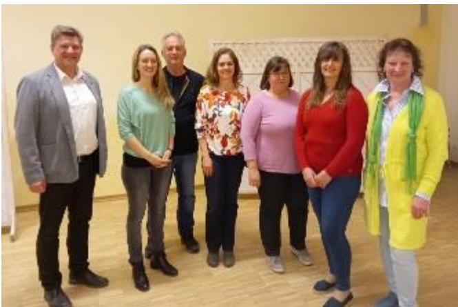
Die neue Vorstandschaft

Bericht: Birgit Mauermaier