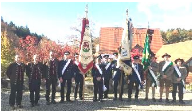
Bocksberger Dreigesang und die Fahnenabordnungen mit ihren Vereinsfahnen