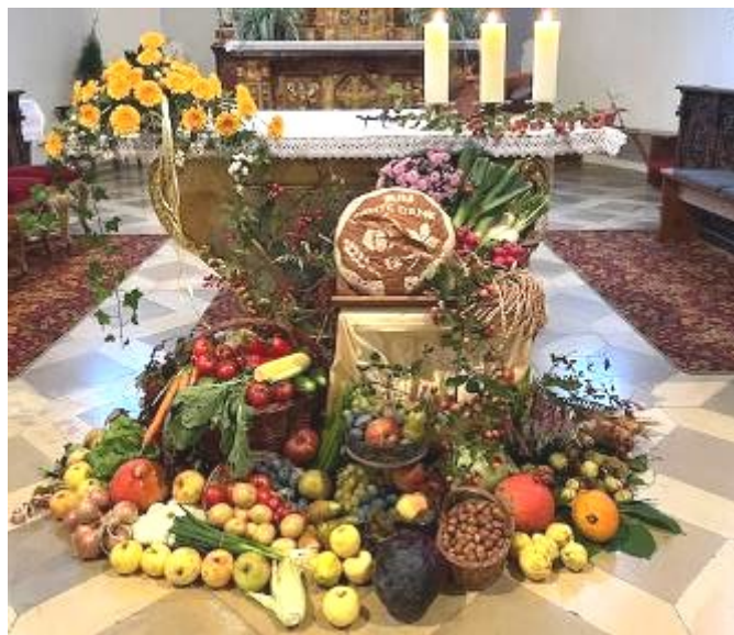
Der schöne Erntedankaltar in Laugna wurde vom Pfarrgemeinderat gestaltet.

Laugna: Dienstag, 12.11., 18:00 Uhr Osterbuch: Donnerstag, 14.11., 18:00 Uhr Bocksberg: Mittwoch, 13.11., 18:00 Uhr Asbach: Freitag, 08.11., 18:00 Uhr