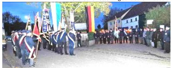
Die Vereine mit Fahnenabordnungen, Musikkapelle und Ehrengästen und die Vorstandschaft des Jubelvereins bei der Beehrung und dem Niederlegen der Schale mit Salutschüssen.