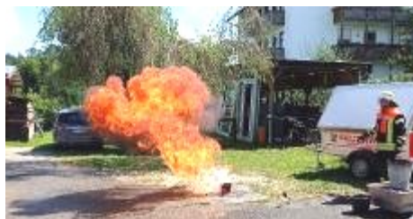
Bericht und Bilder: Feuerwehr Osterbuch

Mit strahlenden Gesichtern und bleibenden Eindrücken traten die Kinder nun den Heimweg an.