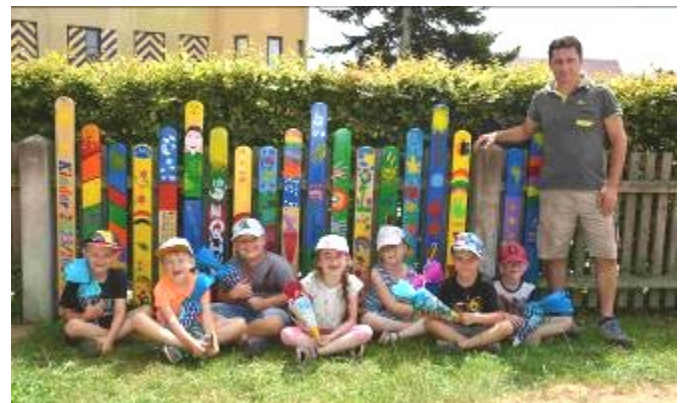
Bericht und Bilder: Kindergarten Laugna

Unglaublich – doch am 26. Juli war nun mit großen Schritten der Abschiedstag gekommen. Zunächst verabschiedete sich die Krippe mit einem rührenden Überraschungslied von unseren „Großen“. Die Vorschulkinder präsentierten stolz ihre Schulranzen und die zu Hause gestalteten, bunt bemalten Zaunlatten. Diese durften sie zusammen mit Peter Glenk am Zaun des Laugnaer Spielplatzes befestigen, um sich so am zukünftigen „Zaun der ehemaligen Vorschüler“ einzureihen. Mit einem weinenden und einem lachenden Auge wurde jedes einzelne Vorschulkind durch einen schön geschmückten Blätterbogen in die Arme seiner Familie geschwungen. Der Kindergarten bedankt sich recht herzlich bei allen Helfern und Familien und vor allem bei den Vorschülern für die Unterstützung und das Gelingen dieser besonderen und einzigartigen Abschiedszeit und wünscht alles Gute für den neuen Lebensweg!